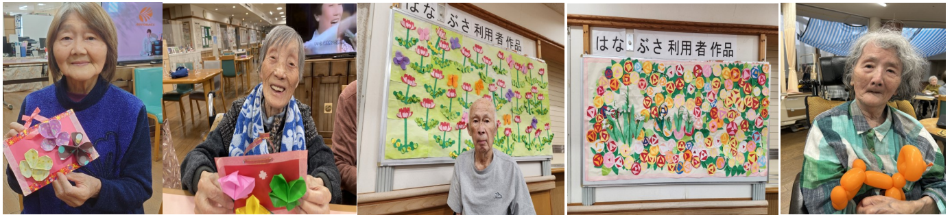
クローバー飾りが出来ました♪