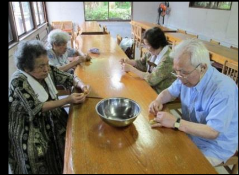
体験型の外出レク 例)草木染め

しかし、 集団的な取り組みが中心となっていたので主体的に取り組むメンバーが固定されてしまった。