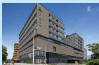
〈急性期病院〉今村総合病院