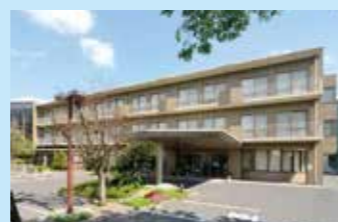
〈老人保健施設〉愛と結の街

急に入院が必要になった場合などにも、関連施設と連携して患者様に必要な医療を提供します。