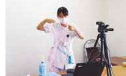
感染管理認定看護師 オンラインによる講習の様子

法人内のような病院・施設での看護実践の経験を生かして専門分野の知識やスキルを深め、質の高いサービスを提供できる看護のスペシャリストへ