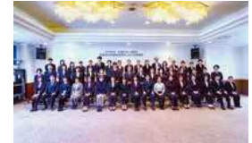
慈愛会管理者任用候補者選考における研修の参加者

質の高い看護サービスの提供をマネジメントする部門・部署の看護管理者や、未来の看護師を育成する看護学校の専任教員へ