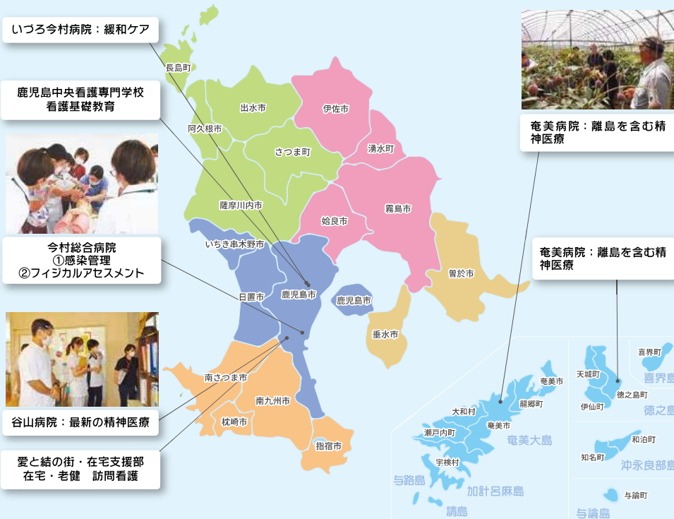
奄美病院：離島を含む精神医療