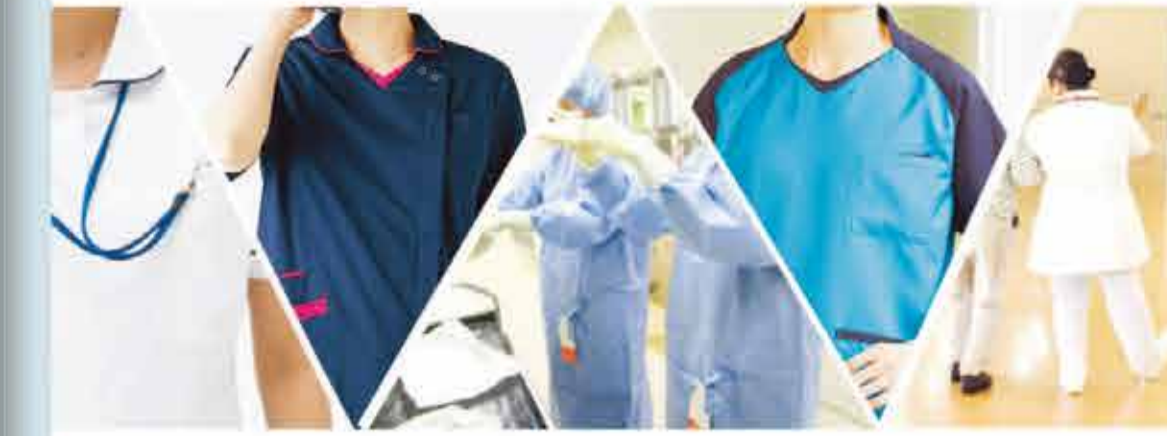
多種多様な患者さんと関わり、一人ひとりに的確な看護を提供する

特定の専門分野にとらわれず、その場に応じた知識・技術・能力が発揮できる看護師として活躍するジェネラリストへ