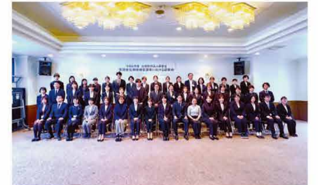
慈愛会管理者任用候補者選考における研修の参加者

質の高い看護サービスの提供をマネジメントする部門・部署の看護管理者や、未来の看護師を育成する看護学校の専任教員へ