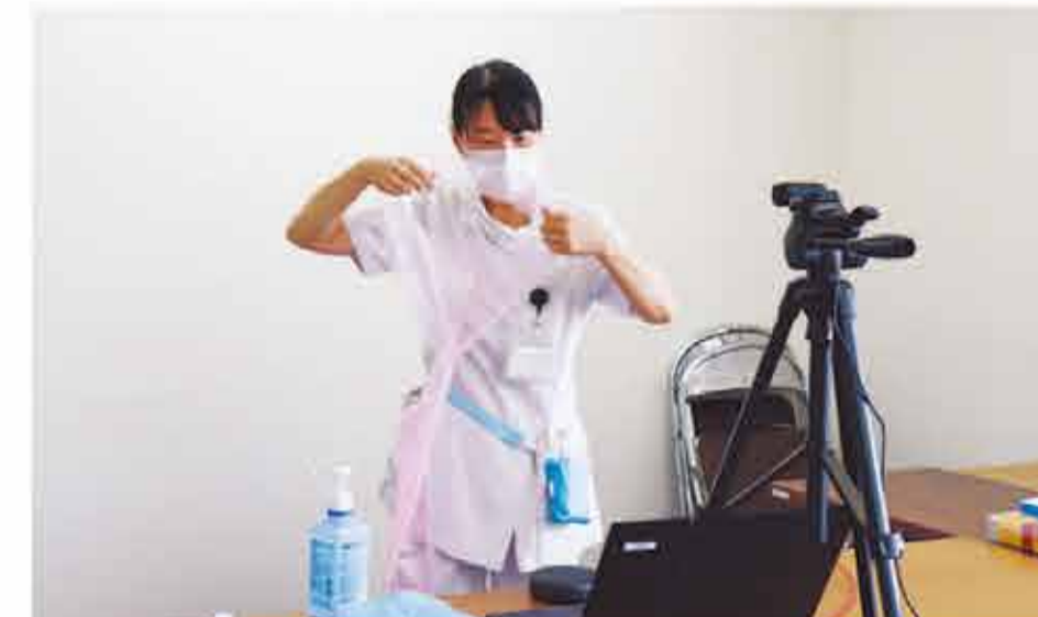
感染管理認定看護師 オンラインによる講習の様子

法人内の様々な病院・施設での看護実践の経験を生かして専門分野の知識やスキルを深め、質の高いサービスを提供できる看護のスペシャリストへ