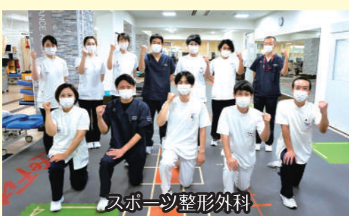
スポーツ整形外科

スポーツ整形外科では、肩関節の腱板損傷と関節唇損傷、膝関節の半月板損傷や靭帯損傷を中心に手術後の理学療法を、また、スポーツ活動によるあらゆる障害に対しての理学療法(ストレッチや体の使い方の指導など)を実施しながら、スポーツ復帰へ向けてのサポートを行っています。上記に関して、現在14名の理学療法士で対応しています。