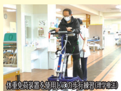
体重負荷装置を使用した歩行練習(理学療法)