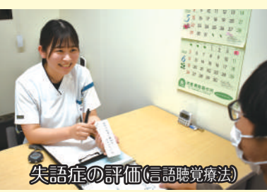
失語症の評価(言語聴覚療法)

脳卒中などの後遺症による「コミュニケーションの問題」(失語症、構音障害、高次脳機能