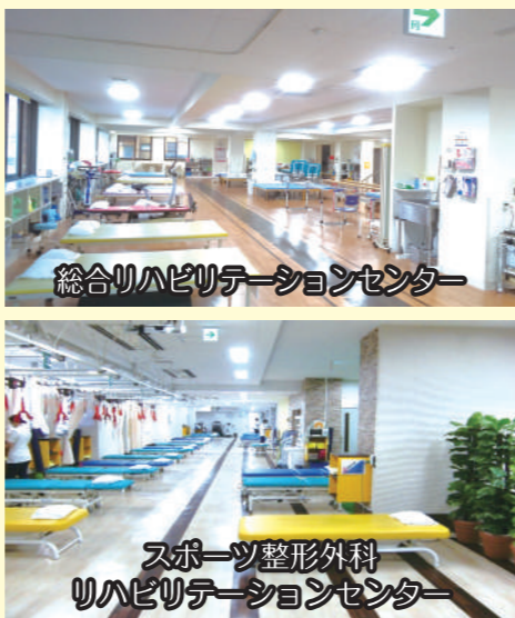
総合リハビリテーションセンター