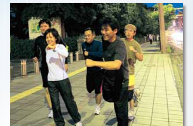
(文責:リハビリセンターPT松元龍)