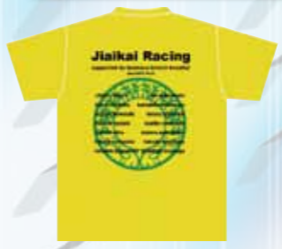
JRC Tシャツ作りました