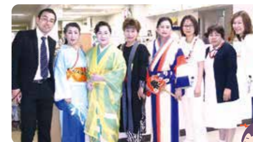
日本舞踊を披露してくださった ボランティアの方々