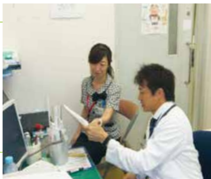
DA(ドクターアシスタント)業務の様子

電子カルテ(診療記録)の入力や検査結果の出力、検査・処方オーダーなどを行っています。そのほかにも、紹介状や返書の作成補助、書類の代行入力、診療に関するデータ整理などを行います。