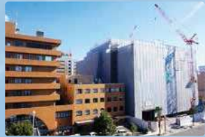
現在(平成28年12月) 新棟工事中