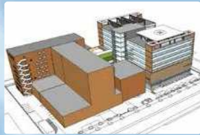
平成29年 6月 新棟完成・オープン