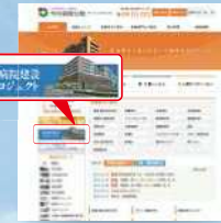
今村病院分院 ホームページ トップページ

公益財団法人慈愛会のホームページに新病院の特設サイトがオープンしました。これまでの工事の進捗状況、WEBカメラによるリアルタイムの現場の様子を見ることが出来ます。トップページのバナーよりアクセスすることが出来ます。工事進捗状況は随時更新されます。ぜひご覧ください。