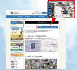
慈愛会 ホームページ 新病院建設工事の進捗状況ページ