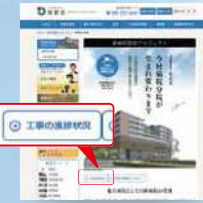
慈愛会 ホームページ 新病院建設プロジェクトページ