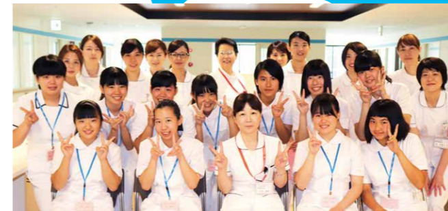
スタッフと参加者のみなさん