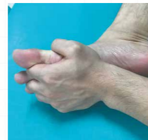
①手の根元から足趾の間に入れて、足指をつかむように握る

足指の間に手の指を入れて、上下に動かしましょう。はじめは「硬い!!」と感じますが、回数を重ねるにつれて、柔らかくなりますよ。お風呂に浸かりながらやると効果的です。