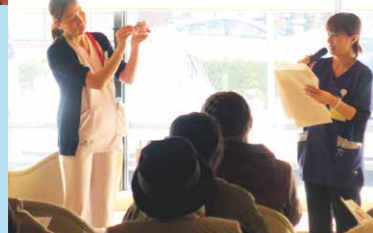
口腔ケア指導教室