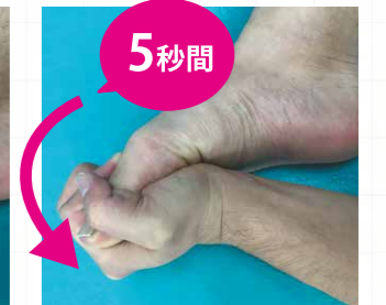
③足の裏の方にゆっくり5秒間曲げる