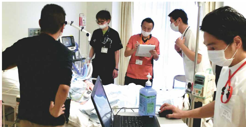
チーム活動の様子

標準的な安全で効果的な呼吸療法を、スタッフ全員で実践できるようにしていきたいと考えています。呼吸ケアのチームメンバーを増やして各病棟へ配置することで、院内全体で患者様のサポートを強化していけることを目標としています。マニュアルや使用物品の見直し、学習会の定期開催、巡回時の現場でのフィードバックなど、患者様・ご家族とスタッフに対して、多方面からサポートできるように活動を継続していきます。