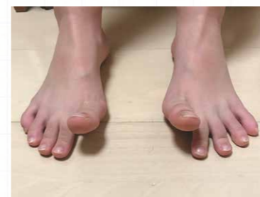
①親指だけを上にあげる動き

足の裏の筋肉や足趾の筋肉を動かしましょう。普段は意識しない動きなので、はじめは動かしづらく感じますが、徐々にできるようになります。