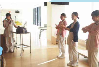
看護師による手洗い指導