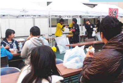
中庭の出店ブース。どの店も大盛況でした