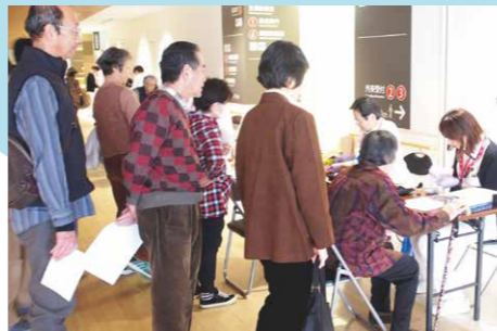
2階の健康チェックにはたくさんの方に お越しいただきました