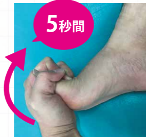
②足の甲の方にゆっくり5秒間曲げる