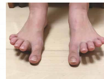
②親指を床に押し付けて、他の指を上あげる動き

足趾を曲げる筋肉や親指の筋肉を使い、足の裏のアーチを作るイメージで!慣れてきたら、交互にくりかえしましょう