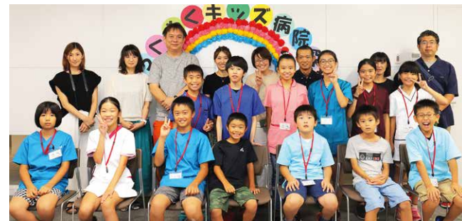
参加キッズと保護者のみなさん

わくわくキッズ病院探検を開催し、11名のキッズたちが手術体験など、様々な医療を体験しました。参加者からは「疲れたけど楽しかった!!」「将来医者になりたいので貴重な経験ができた」などの声がかれました。