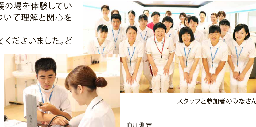
スタッフと参加者のみなさん

将来また一緒に白衣を着られる日が来ることを願っています。参加者のみなさん、ありがとうございました!