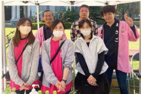
鴨池校区コミュニティ協議会メンバー

地元の鴨池校区コミュニティ協議会の皆様には、物産展の運営、キッチンカーの手配、特産品協会との橋渡しと多岐に渡りご協力いただきました。一医療機関が地元の皆様に多くのご支援をいただけたことは、この上ない喜びです。今後とも地元の皆様と共に歩んでいける医療機関でありたいと思います。