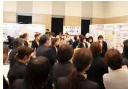
クリティカルバス展示