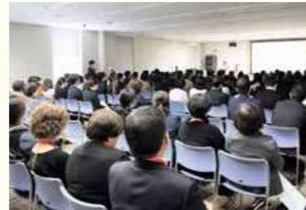
ランチョンセミナー