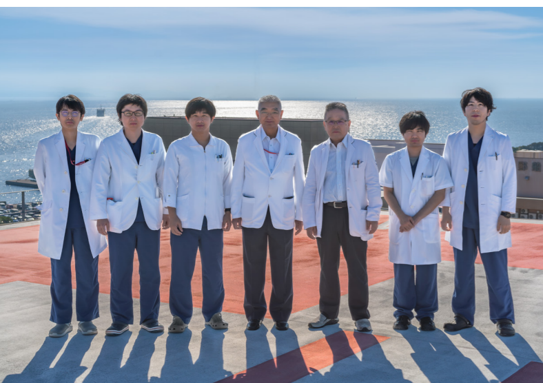
▲外科・消化器外科チーム(2023年11月撮影)

外科・消化器外科は、2013年にいづろ今村病院より移転し、今年で10年を迎えました。患者さんと、共に歩んできた多くのスタッフに深く感謝申し上げます。今後も一層、医療の質向上と患者さんに寄り添う医療に尽力してまいります。