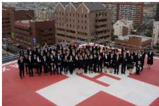
[多職種での入職式]