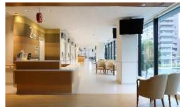
[外来診察室前待合風景]