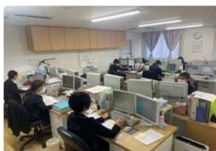
[医事課の計算の様子]