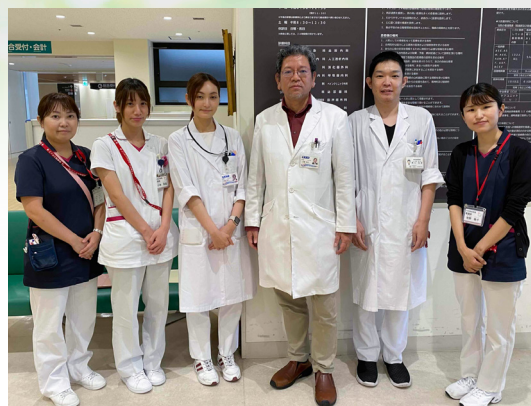
宮園輸血管理部長と輸血管理部スタッフ

また、手術に備えた自己血の採取・保存・出庫、そして、造血幹細胞移植のための採取前幹細胞数測定と採取、幹細胞の調整・保存・出庫、最近では『細胞療法』（ヒト骨髄由来間葉系幹細胞テムセルHS注）のための細胞保存・調整・出庫の業務も行っております。