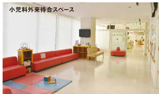
小児科外来待合スペース