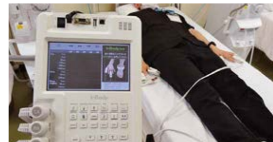
スタッフを使つての測定風景