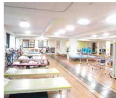
3階リハビリテーションセンター