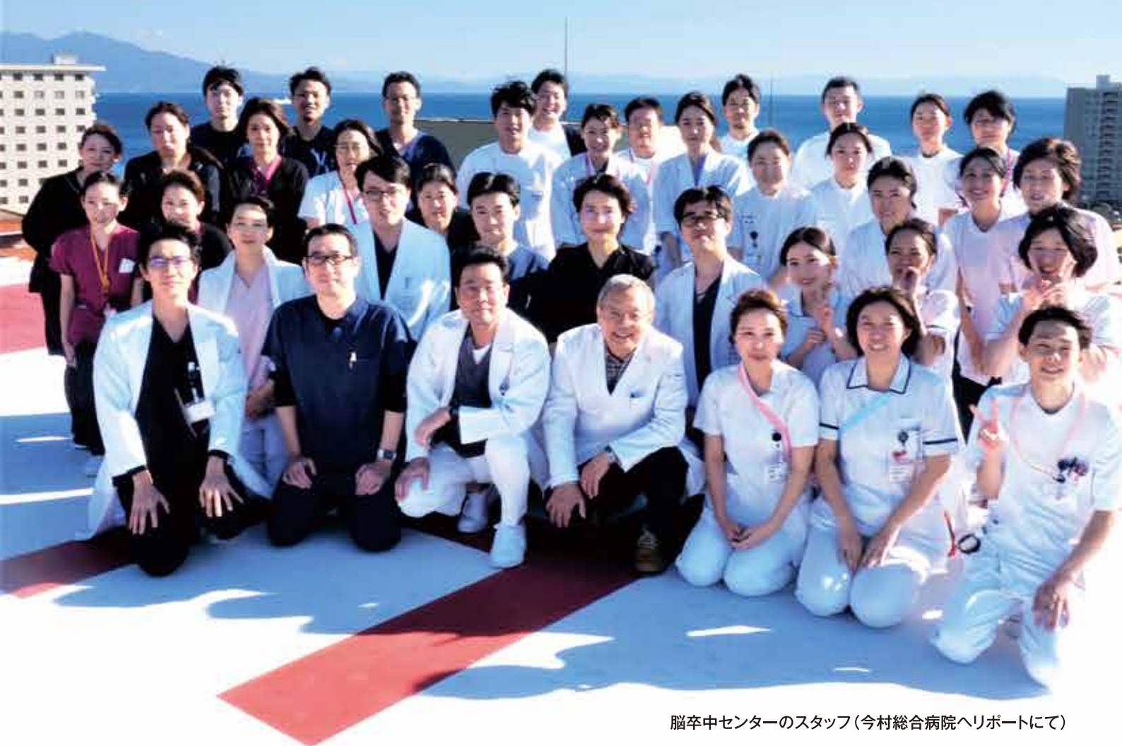
脳卒中センターのスタッフ(今村総合病院へレポートにて)