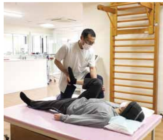
運動リハビリの様子

当院では365日、理学療法士・作業療法士・言語聴覚士がリハビリテーションを行っています。SCUの専従リハビリスタッフが在籍し、発症後すぐにリハビリを行えるのが当院の強みです。急性期からの摂食嚥下評価にも力を入れています。