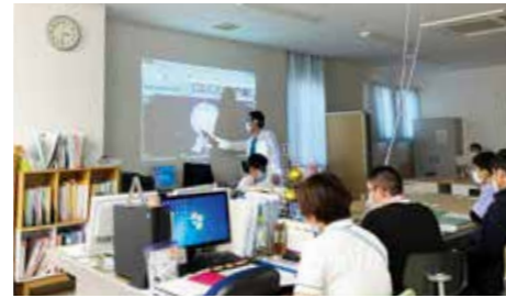
カンファレンスの様子

多職種のスタッフを交えて週1回のカンファレンスを行っています。それぞれのスタッフが専門的な視点で患者様のサポートを行い、治療方針を決定しています。