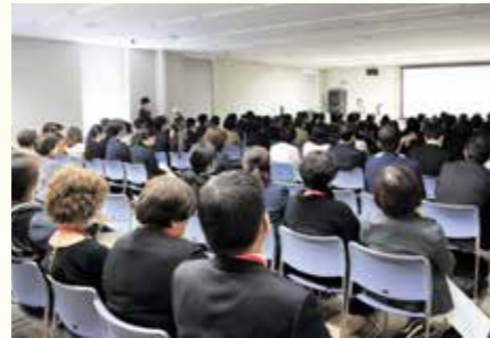
ランチョンセミナー