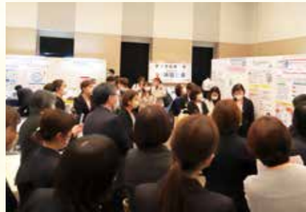
クリティカルパス展示