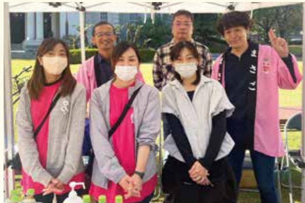
鴨池校区コミュニティ協議会メンバー

地元の鴨池校区コミュニティ協議会の皆様には、物産展の運営、キッチンカーの手配、特産品協会との橋渡しと多岐に渡りご協力いただきました。一医療機関が地元の皆様に多くのご支援をいただけたことは、この上ない喜びです。今後とも地元の皆様と共に歩んでいける医療機関でありたいと思います。