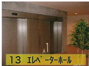
13 エレベーターホール